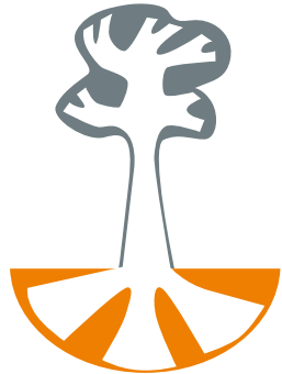
DE BASIS OP ORDE